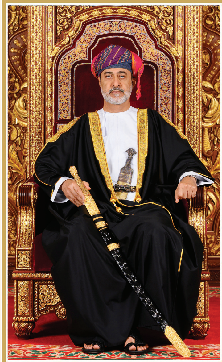
حضرة صاحب الجلالة السلطان هيثم بن طارق المعظم -حفظه الله ورعاه-