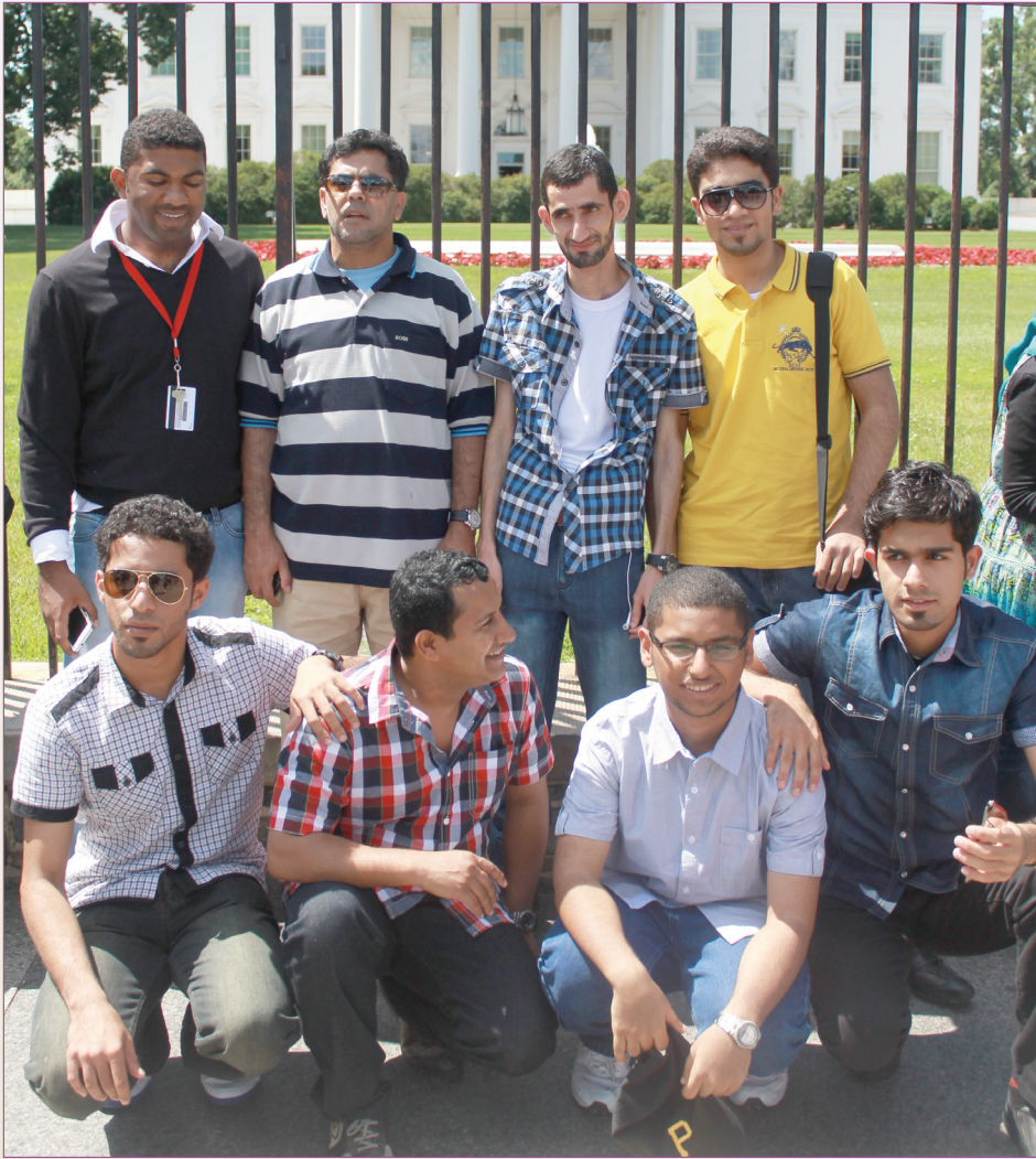
الوفد الطلابي العماني يختتم زيارته إلى أمريكا