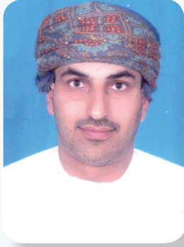
إعداد : سيف بن حارب الغافري رئيس قسم البحوث