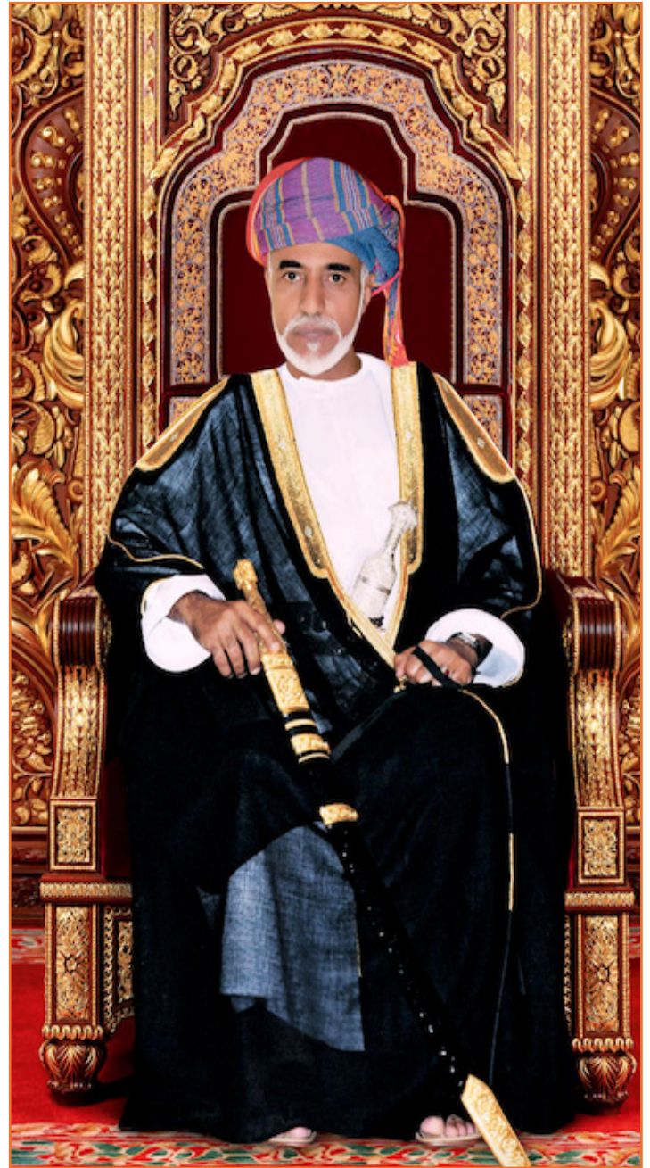
حضرة صاحب الجلالة السلطان هيثم بن طارق المعظم - حفظه الله ورعاه -