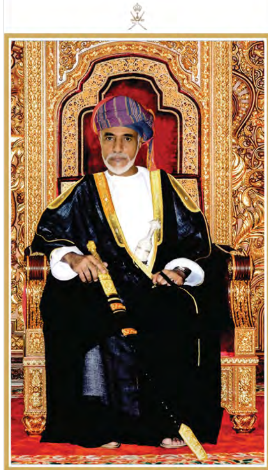
المغفور له السلطان قابوس بن سعيد طيب الله ثراه