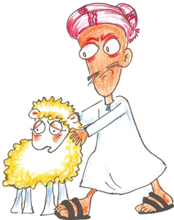
قبض المعلم على لولو المشاكسة The teacher catches Lolo