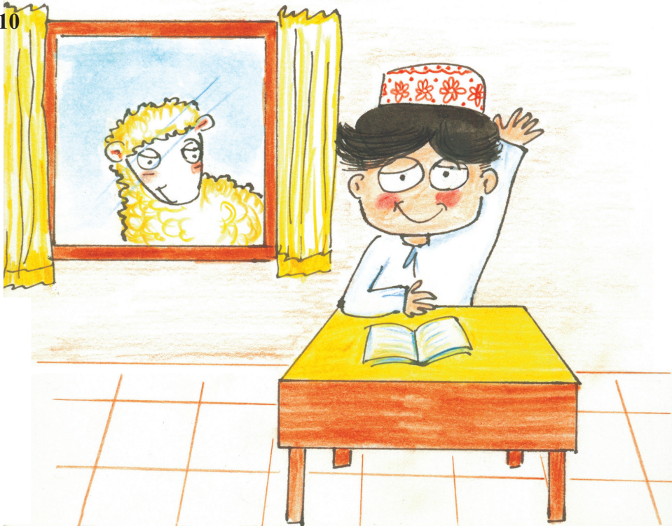
Lolo waiting for Hamood outside