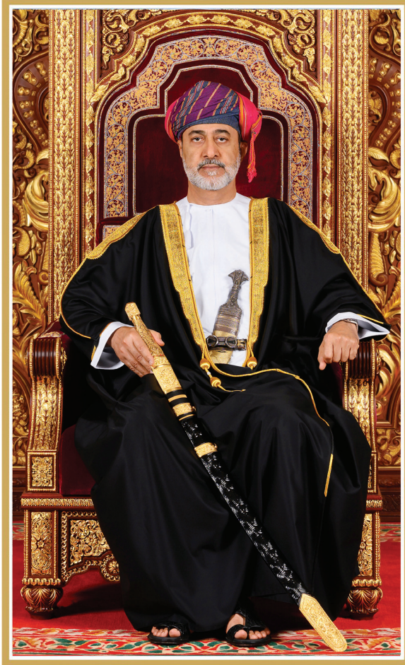
حضرة صاحب الجلالة السلطان هيثم بن طارق المعظم - حفظه الله ورعاه -