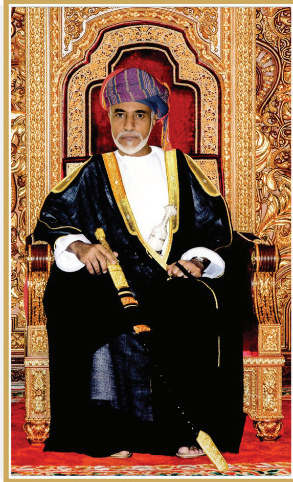
المغفور له السلطان قابوس بن سعيد - طيب الله ثراه -