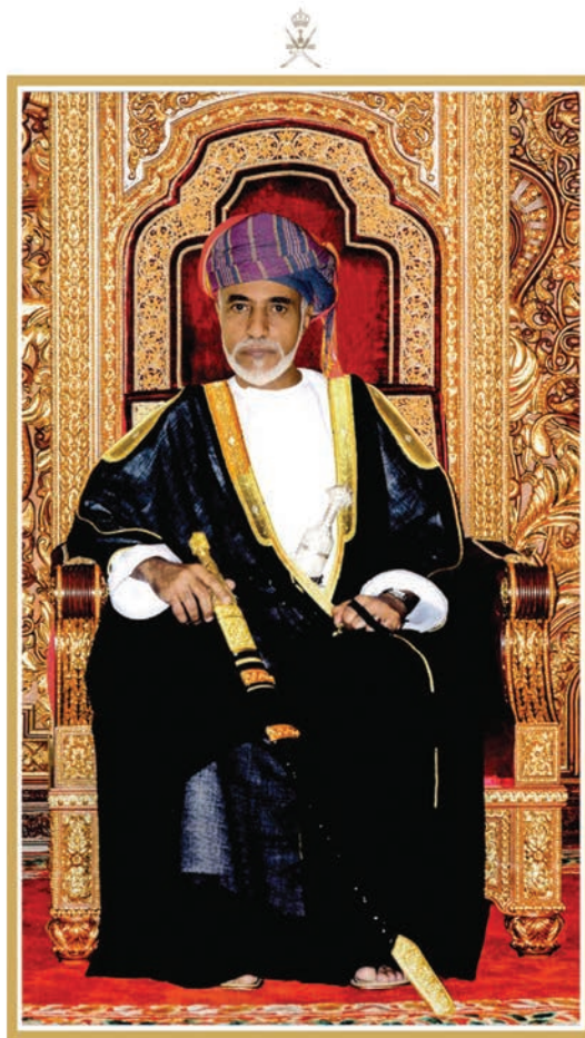
المغفور له السلطان قابوس بن سعيد طيب الله ثراه