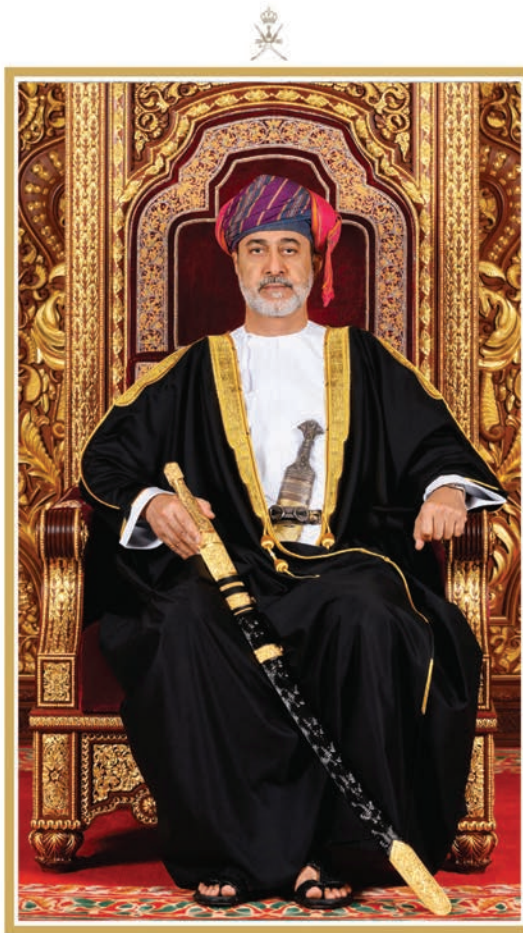
حضرة صاحب الجلالة السلطان هيثم بن طارق المعظم حفظه الله ورعاه