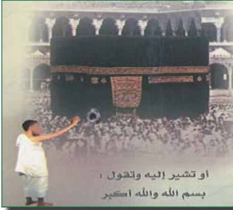
أو تشير إليه وتقول ، بسم الله والله أكبر

• أن يجعل الكعبة عن شماله ويبدأ الطواف بتقبيل الحجر الأسود إن استطاع، أو يلمسه ويقبل يده، أو يشير إليه مع التكبير ويدعو بما شاء من الأدعية مع التسبيح والتحميد والتهليل والتكبير.