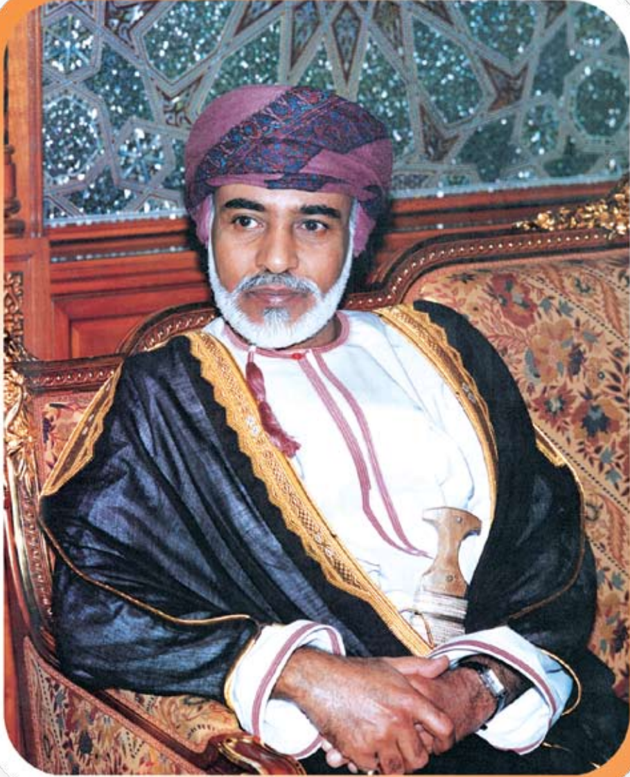
حضرة صاحب الجلالة السلطان قابوس بن سعيد المعظم