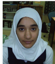
أمل الكلبانية تظهر الصحة النفسية للطالب في قدرة الطالب على التفاعل مع المجتمع