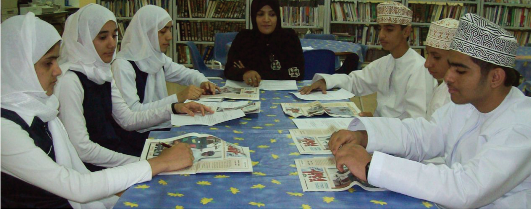
■ جانب من الحلقة النقاشية