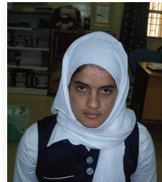
أمل الجساسة التوجيه المدرسي يسعى إلى فهم الطالب وسلوكياته ومعالجتها إيجابيا